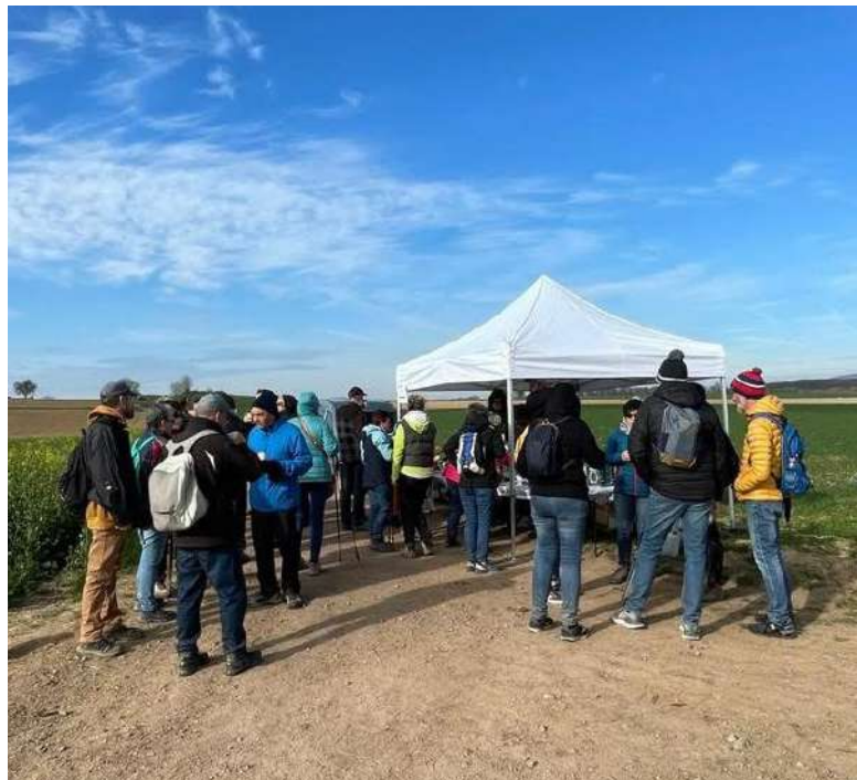
300 personnes ont participé à la marche de printemps organisée par le Groupe Folklorique