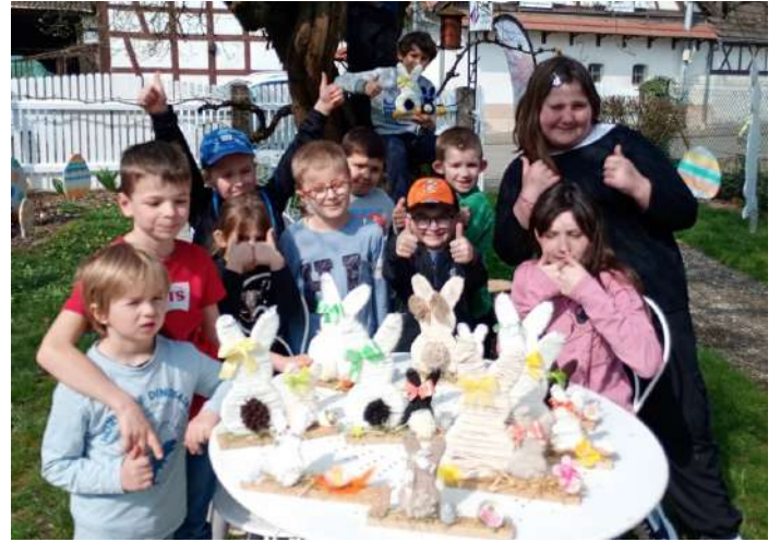
Décorations de Pâques réalisées au péricolaire