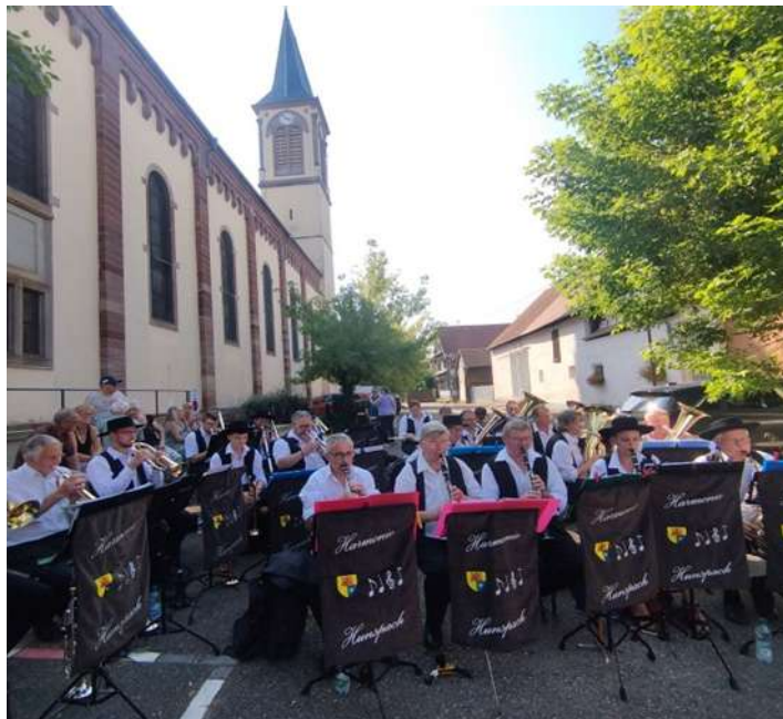
Concert de l'Harmonie de Hunsbach lors de la fête des récoltes d'antan de Hindisheim