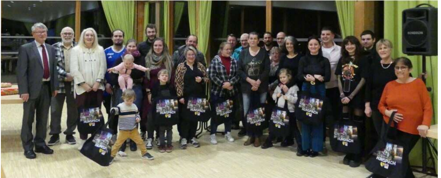
De nombreux nouveaux habitants ont été accueillis à l'occasion des Vœux de la municipalité