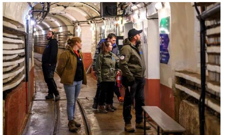
Des visiteurs découvrent le Fort de Schœnenbourg