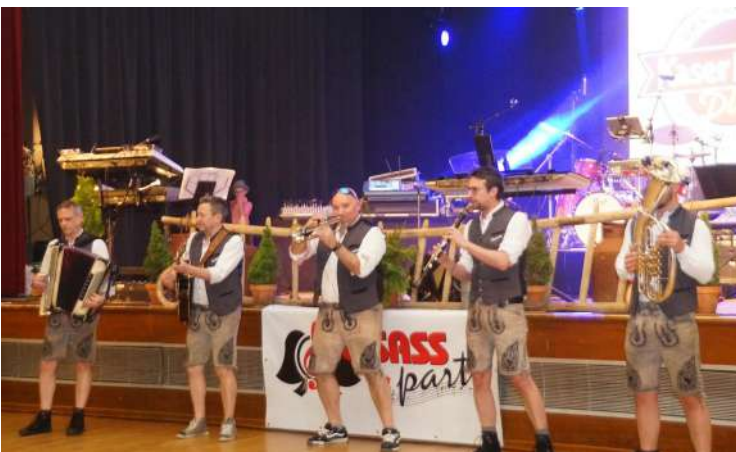
Le Bierfest organisé par Elsass Party