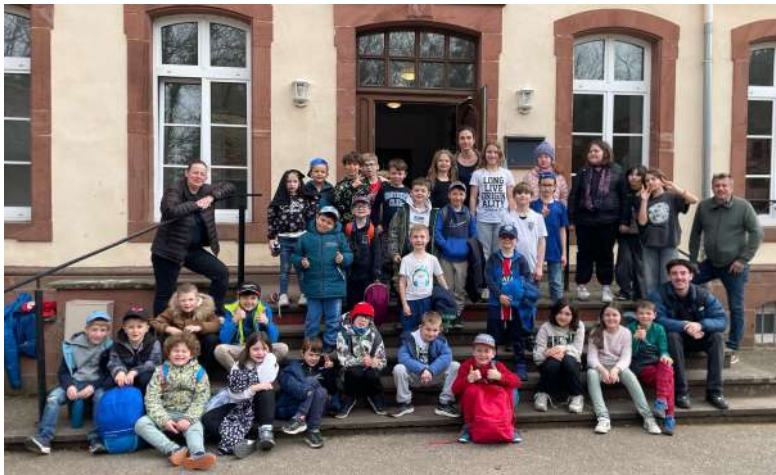
Les élèves de l'école élémentaire se sont rendus en classe verte au centre Ethic Etapes de Neuwiller-lès-Saverne