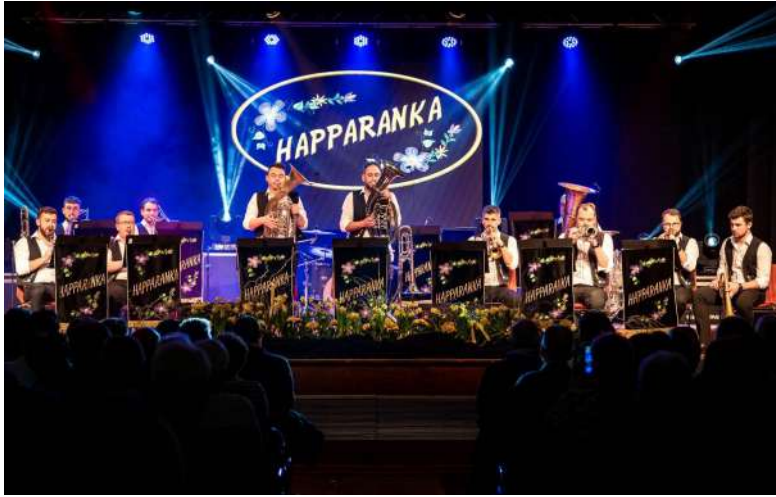
Concert annuel de l'ensemble musical Happaranka